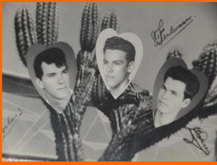
Trio Los Madrigales